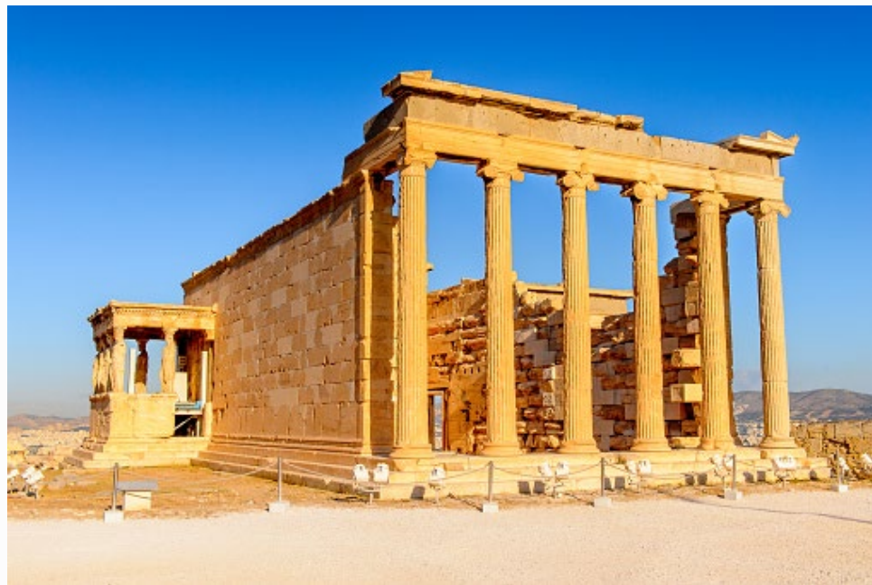
Imagem 1. Templo Erectéion, Grécia.

Em Roma, o Império Romano expandiu esse legado, destacando-se na engenharia civil, no direito e literatura.