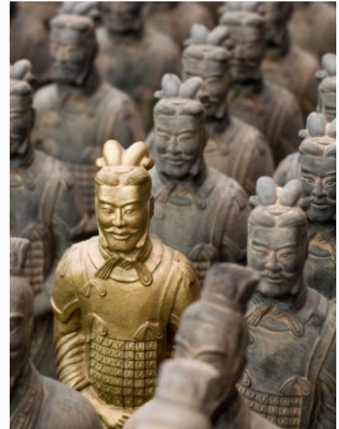
Imagem 2. Exército de terracota, China.

A civilização sínica , centrada na China , apresentou uma rica tradição cultural. Suas contribuições incluem a ciência, a arte e a filosofia . A civilização hindu , predominantemente na Índia, destacou-se com filosofia, religião e artes . Textos sagrados como os Vedas (divididos em Samaveda , Rigveda , Yajurveda e Atharvaveda ) são testemunhas da riqueza cultural hindu. A civilização islâmica , abrangendo do Oriente Médio à Península Ibérica, destaca-se por seus avanços em Matemática, medicina e Astronomia .